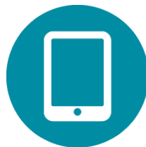
Επικοινωνία - διάχυση